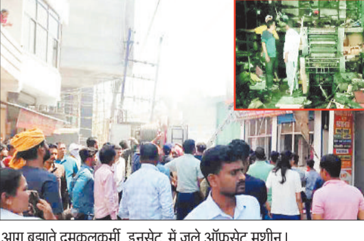
आग बुझाते दमकलकर्मी, इनसेट में जले ऑफसेट मशीन।

शहर के गुदरी चौक के समीप आज सुबह उस समय अफरा-तफरी की स्थिति निर्मित हो गई जब अचानक एक प्रिंटर एण्ड स्टेशनरी दुकान में आग लग गई। लोग कुछ समय पाते इससे पहले ही आग पूरी दुकान में फैल गई। वहां दमकल टीम को आग पर काबू पाने के लिए दो वाहनों का सहारा लेना पड़ा। आगजनी से दुकान के तीन ऑफसेट मशीन सहित लगभग एक करोड़ के सामान जल कर खाक हो जाने की आशंका जताई जा रही है। इधर आसपास के लोगों ने आगजनी होने के पीछे शॉट-सर्किट होने की आशंका जताई है। जानकारी के मुताबिक आज सुबह गुदरी चौक के समीप निवासी