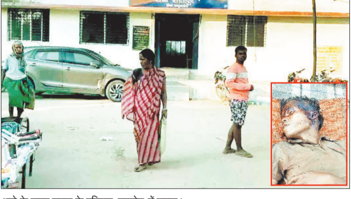
घाने के बाहर मृतक के परिजन, इनसेट में मृतक।