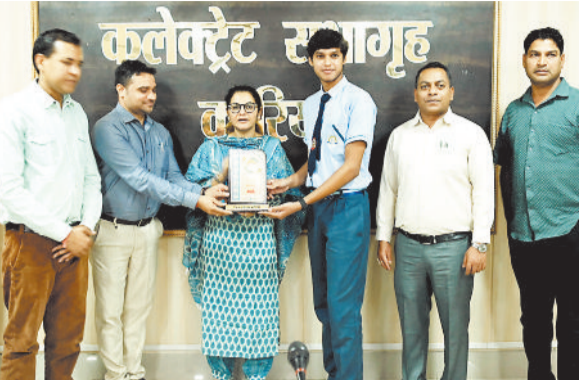
सम्मानित होते विद्यार्थी

बैकुण्ठपुर। छग माध्यमिक शिक्षा मंडल रायपुर द्वारा 7 मई को घोषित बोर्ड परीक्षा परिणामों में जिले ने उत्कृष्ट प्रदर्शन किया है। जिले का समग्र परिणाम 92.42 प्रतिशत रहा। प्रदेश में हाई स्कूल परीक्षा में चतुर्थ और हायर सेकेडरी परीक्षा में द्वितीय स्थान प्राप्त हुआ है। उत्कृष्ट परीक्षा परिणाम हासिल करने वाले छात्रों का सम्मान समारोह कलेक्ट्रेट सभाकक्ष बैकुण्ठपुर में आयोजित किया गया।